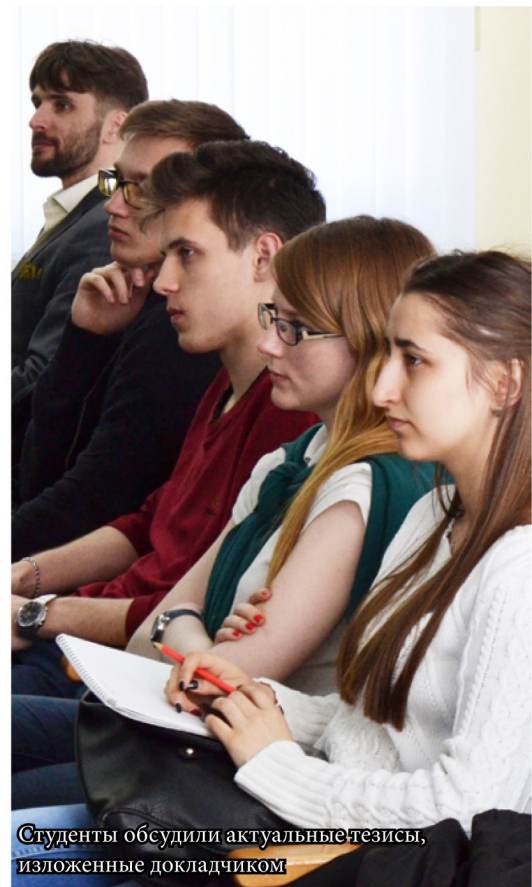
Студенты обсудили актуальные тезисы, изложенные докладчиком