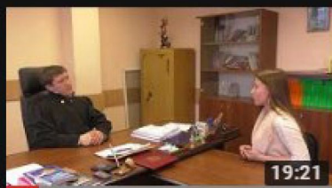
Своя территория № 3 Суд. Судья. Судейская...