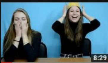
Своя территория №2 По правде говоря