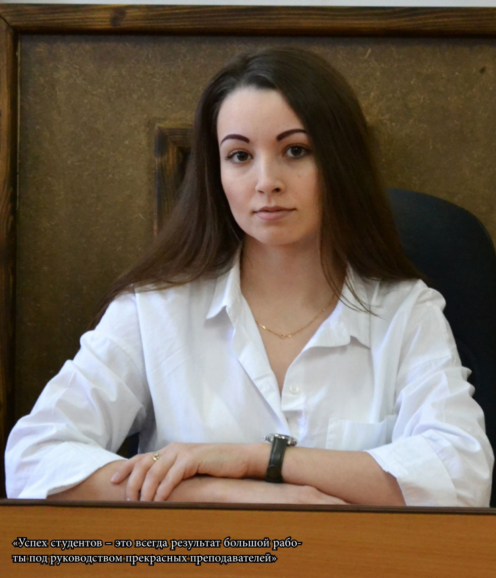
«Успех студентов – это всегда результат большой работы под руководством прекрасных преподавателей»