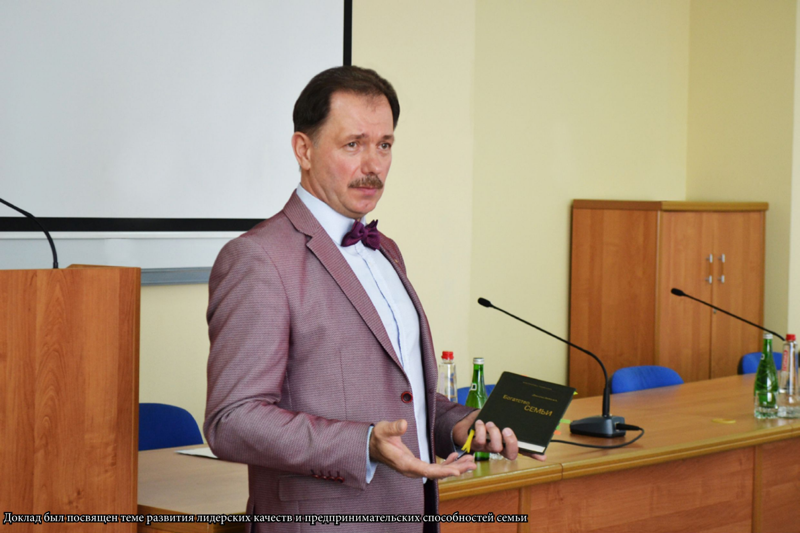
Доклад был посвящен теме развития лидерских качеств и предпринимательских способностей семьи